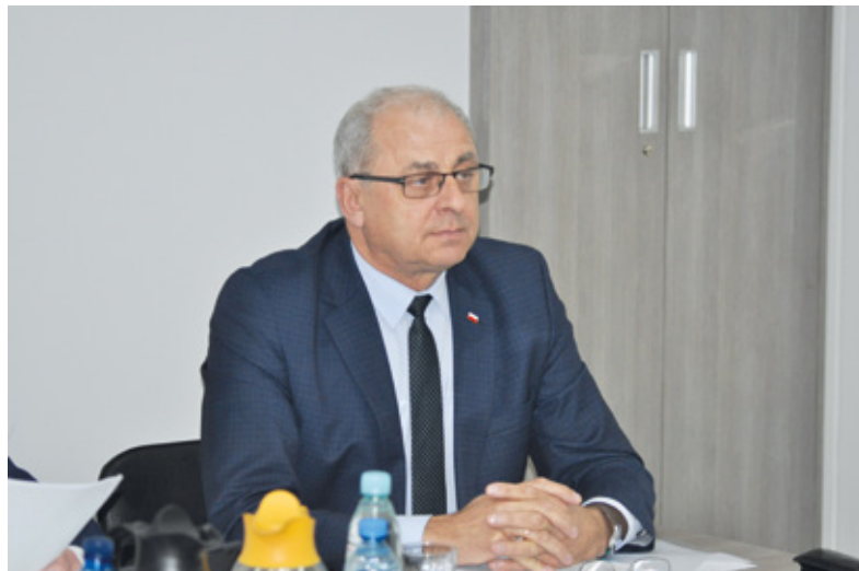
W gminie Przystajń postawiono głównie na możliwość wymian źródeł energii przez mieszkańców.

OGRZEWANIE. W gminie Przystajń głównie w budynkach mieszkalnych, a w gminie Miedźno w szkole nastąpi wymiana źródeł energii. To efekty projektu, w którym obie gminy skutecznie wystąpiły o dofinansowanie z urzędu marszałkowskiego