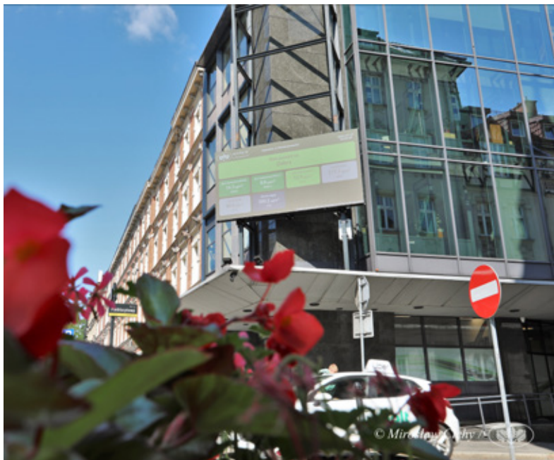
Nowa tablica pozwala odczytać dane o jakości powietrza.

Po trwającej ponad rok przerwie na budynku Wojewódzkiego Funduszu Ochrony Środowiska i Gospodarki Wodnej w Katowicach, na rogu ulic Plebiscytowej i Jagiellońskiej,